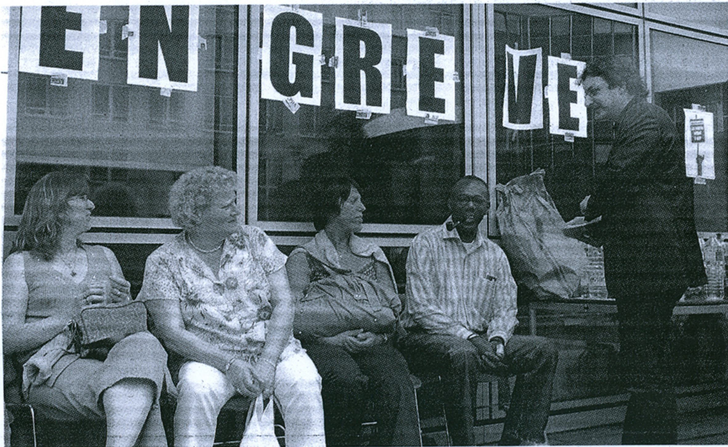
Les salariés de WKF en grève contre un plan social concernant 177 emplois, au siège de Rueil-Malmaison, en juillet 2008.